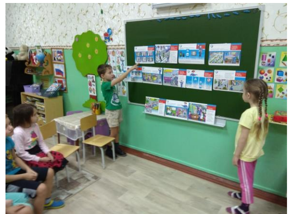
В течении дня дети играли в сюжетные игры с ПДД